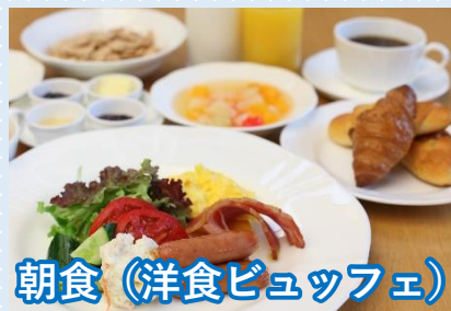
朝食（洋食ビュッフェ）