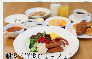
朝食(洋食ビュッフェ)